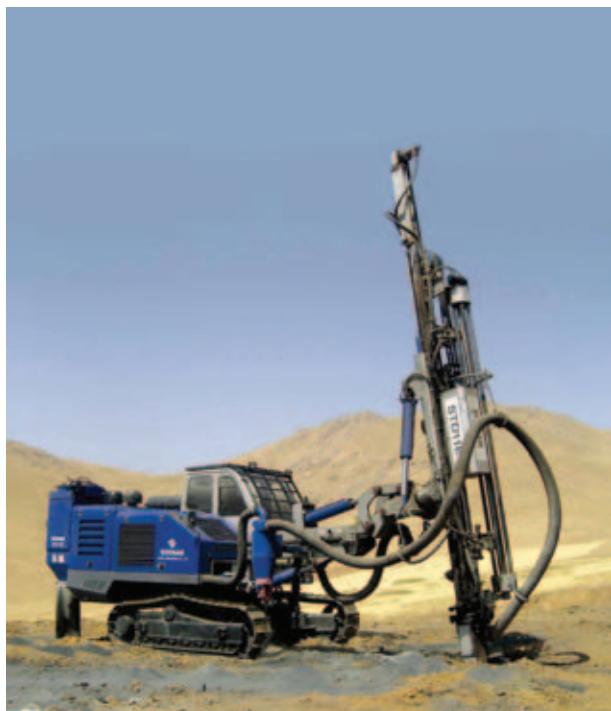
Bušilica sa spoljnim čekićem STDE14E

Visokokvalitetne bušilice jednog od najvećih proizvođača bušaćih agregata u Kini SOOSAN, namjenjene za bušenje na površinskim kopovima.