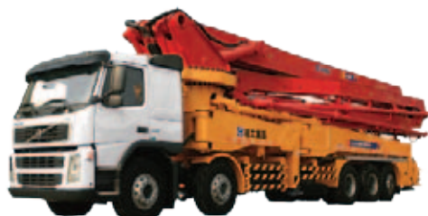
Pumpa za beton